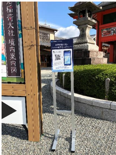
外拝殿横の境内案内看板横