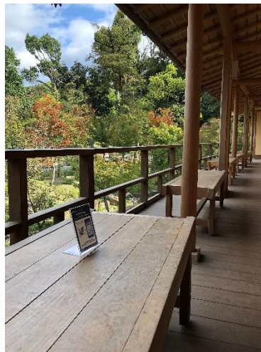
啼鳥菴(休憩所)の床几